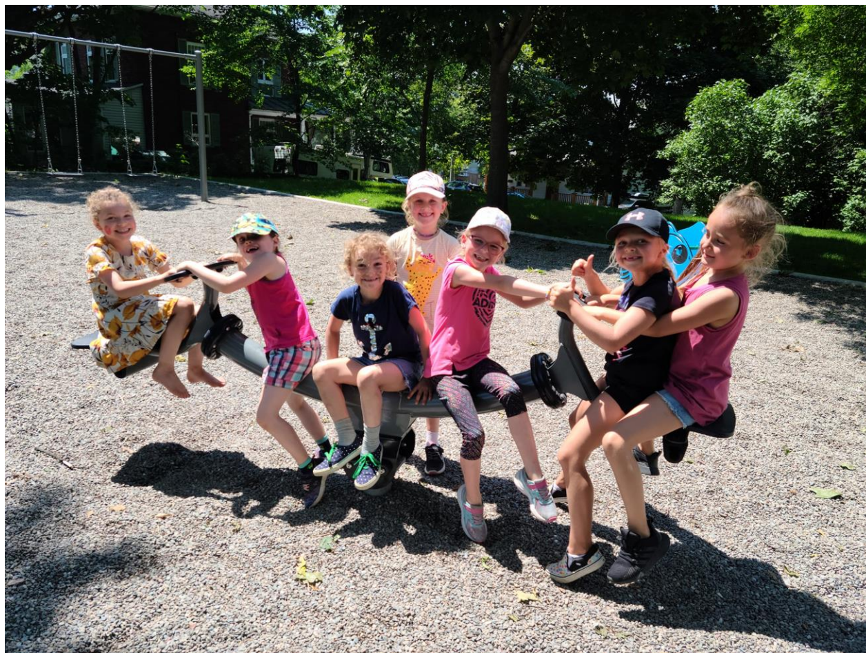
Enfants participant au Camp de jour chant et danse, été 2021