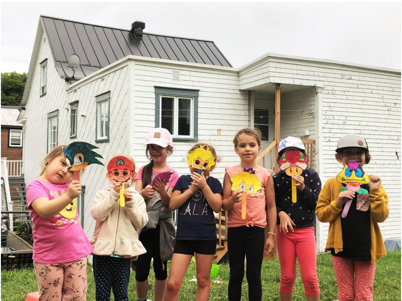
Des jeunes du camp de jour présentent les masques qu'ils ont créés pour leur spectacle.

Depuis 2014, l'Accroche Notes offre des cours de musique (loisir) dans les quatre locaux de musique du Juvénat Notre-Dame. Cette opportunité de suivre leurs cours à St-Romuald est très appréciée par les élèves de ce secteur. Toutefois, le défi d'y fidéliser la clientèle est bien présent puisque le taux de roulement des professeurs y est plus grand: ces derniers préfèrent enseigner dans le Vieux-Lévis en raison des services offerts aux professeurs, de la dynamique des lieux et de la disponibilité des locaux.