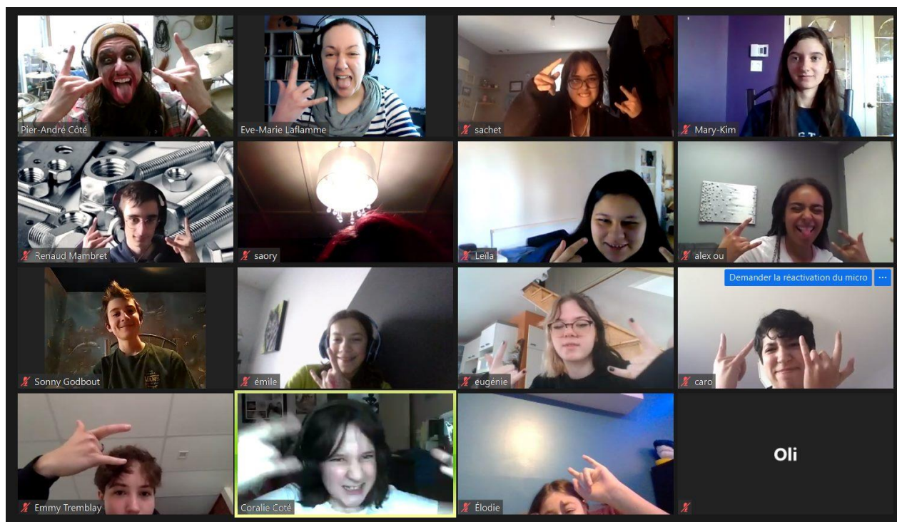
Les élèves du programme PALS musique-études lors d'un cours donné par vidéoconférence