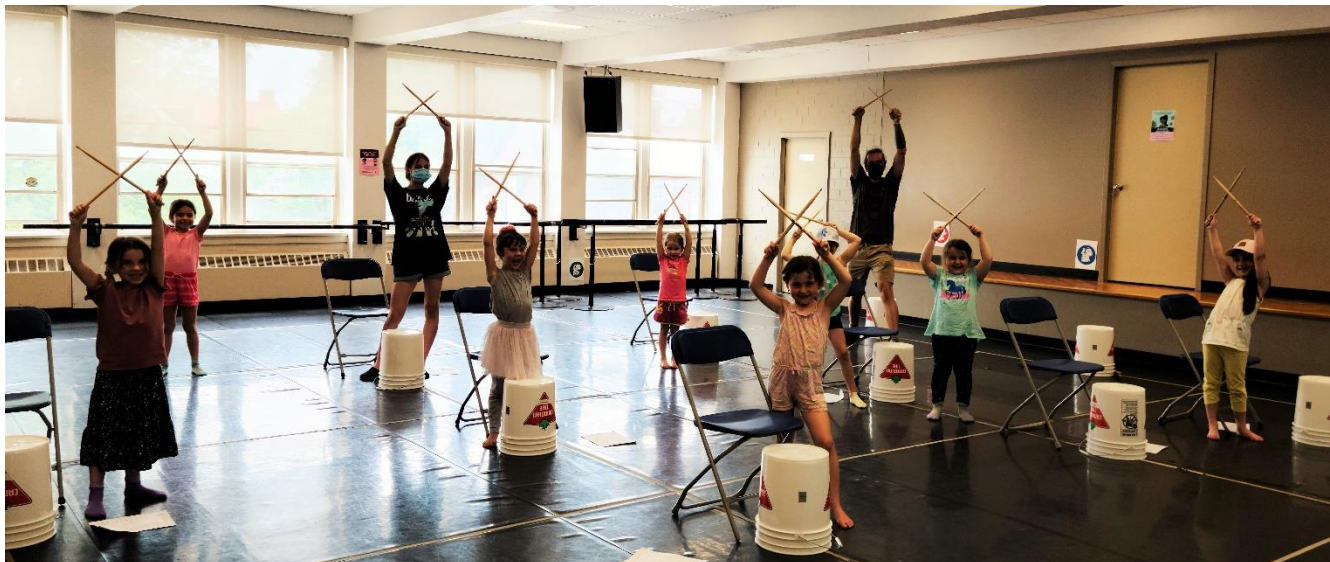
Les élèves du camp de jour ont développé leur rythme avec une activité de percussions.

* : Ce pourcentage anormalement bas est dû à la subvention salariale fédérale, qui a gonflé les revenus totaux.