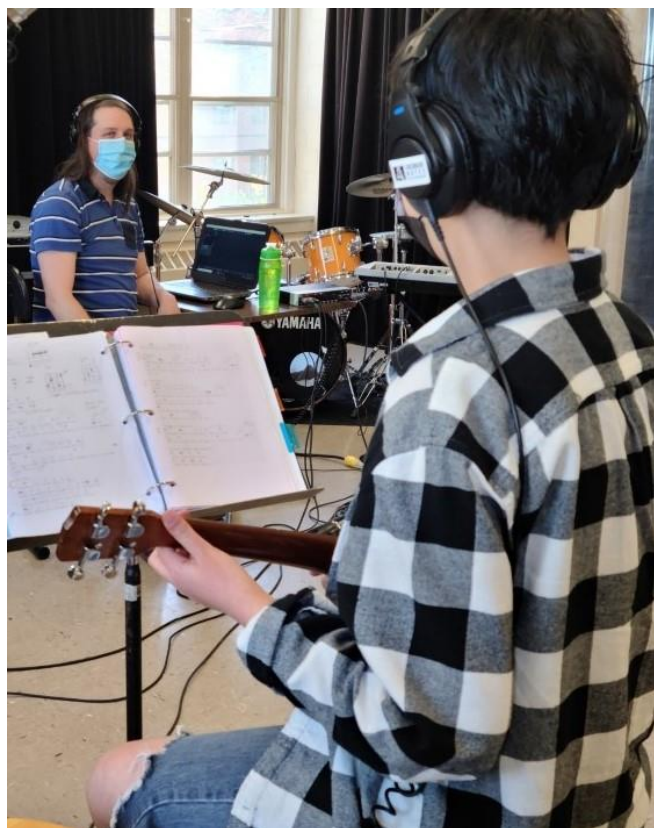
Enregistrement de l'album PALS

* : 0 : Camp de l'été 2020 (fermé en raison de la Covid). À titre indicatif, le camp de l'été 2021 : 56 inscriptions.