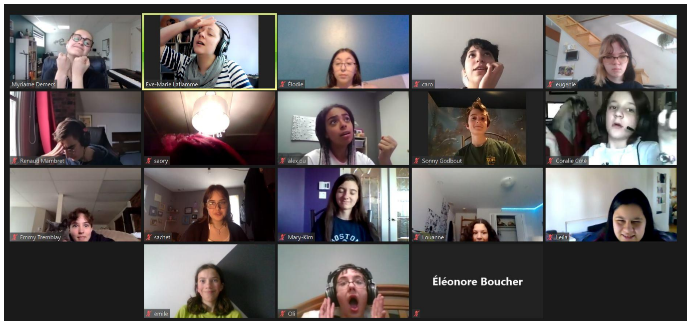
Les élèves du PALS durant un atelier spécial virtuel sur l'interprétation musicale

Les cours par vidéoconférence deviendront un service régulier à l'Accroche Notes.