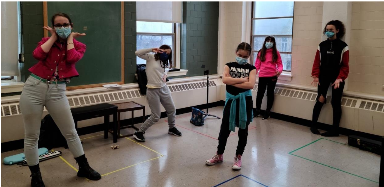
Quelques élèves du PALS durant une activité de création musicale

Au terme de l'année 2020-2021, nous pouvons affirmer que l'Accroche Notes a complété son projet d'optimisation des opérations : elle possède et a intégré les outils nécessaires à une plus grande efficacité administrative et elle sera prête à accueillir une croissance substantielle de clientèle suite à sa relocalisation.