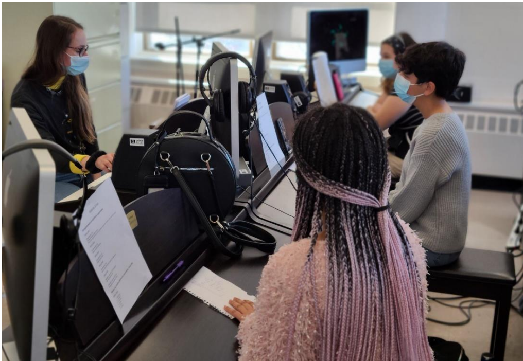
Quelques élèves de musique-études durant un atelier de création