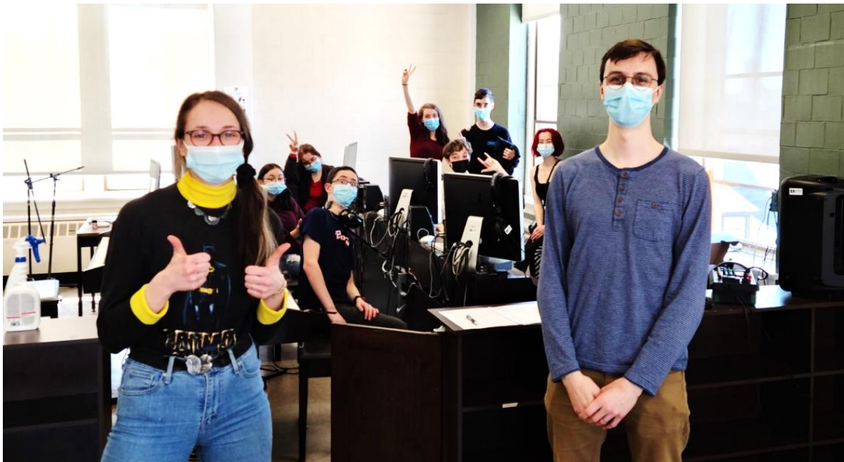
Des élèves de musique-études dans une activité de création