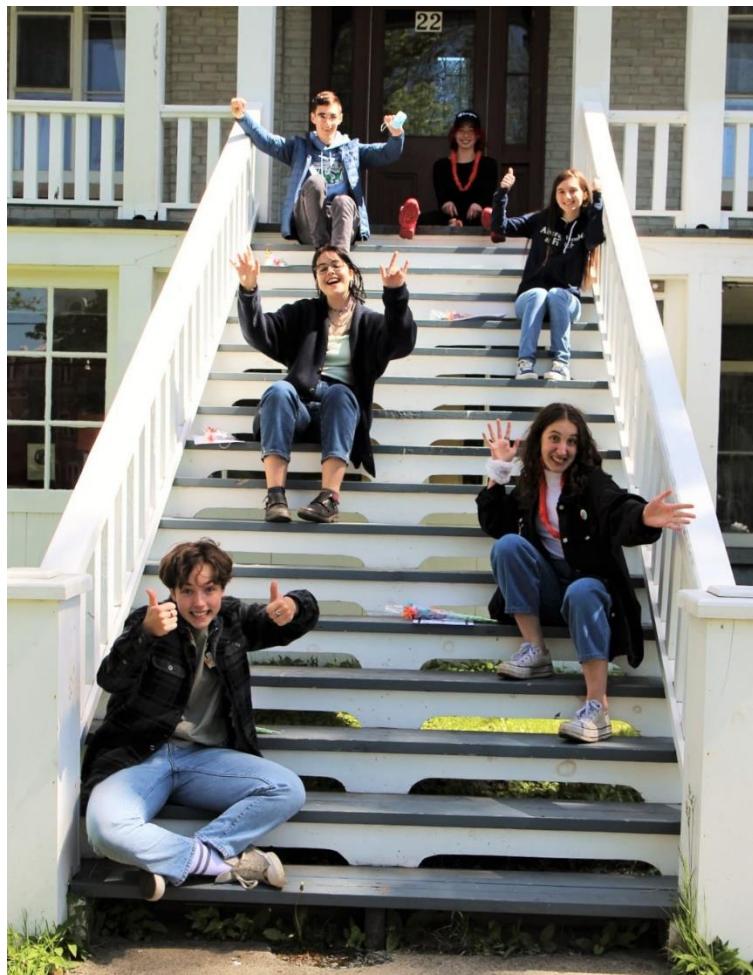
Nos finissants PALS 2020-2021