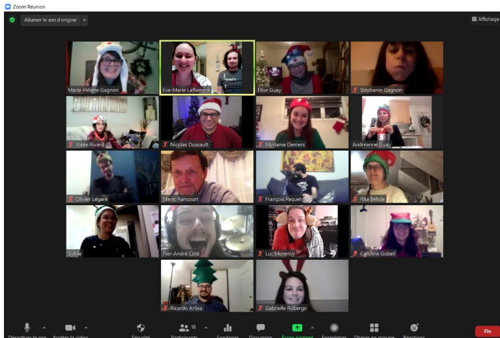
Une partie de l'équipe au « party » de Noël virtuel des employés, décembre 2020