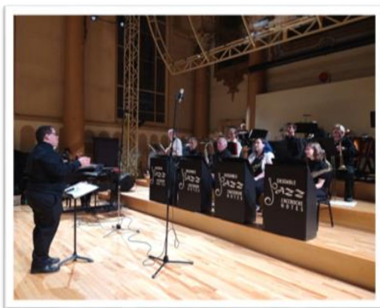
Captation vidéo de l'Ensemble Jazz l'Accroche Notes, à l'Espace Symphonique de Lévis