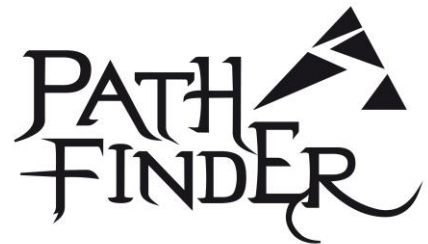
Les trois groupes formés à l'occasion du projet intégrateur multidisciplinaire et leurs logos respectifs