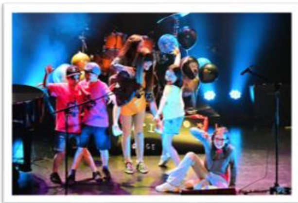
Photos du concert PALS de fin d'année intitulé TAPIS ROUGE