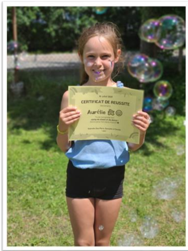
Une élève bien fière d'avoir reçu son diplôme à la fin du camp de danse et musique