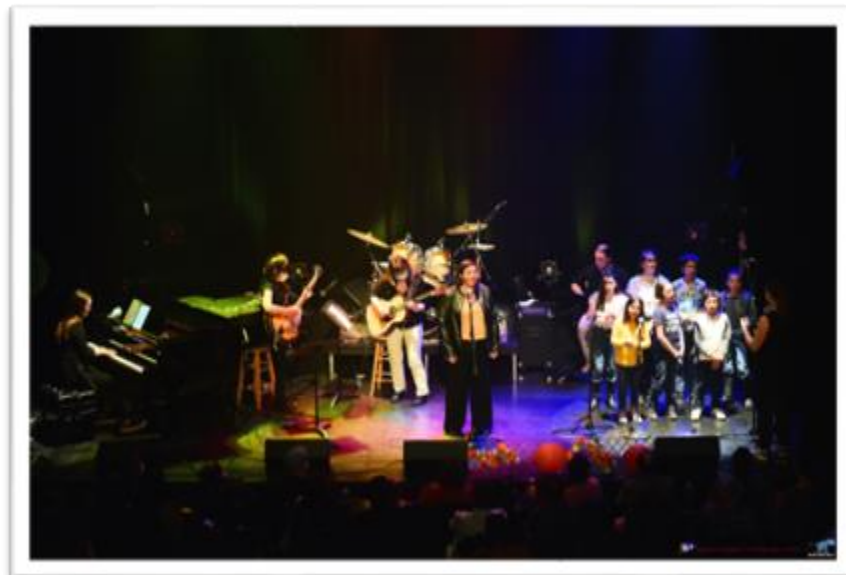
Des élèves des cours loisirs et le groupe vocal l'Accroche Chœur à l'occasion du Concert Acoustique ayant eu lieu à l'Anglicane de Lévis en mai 2022