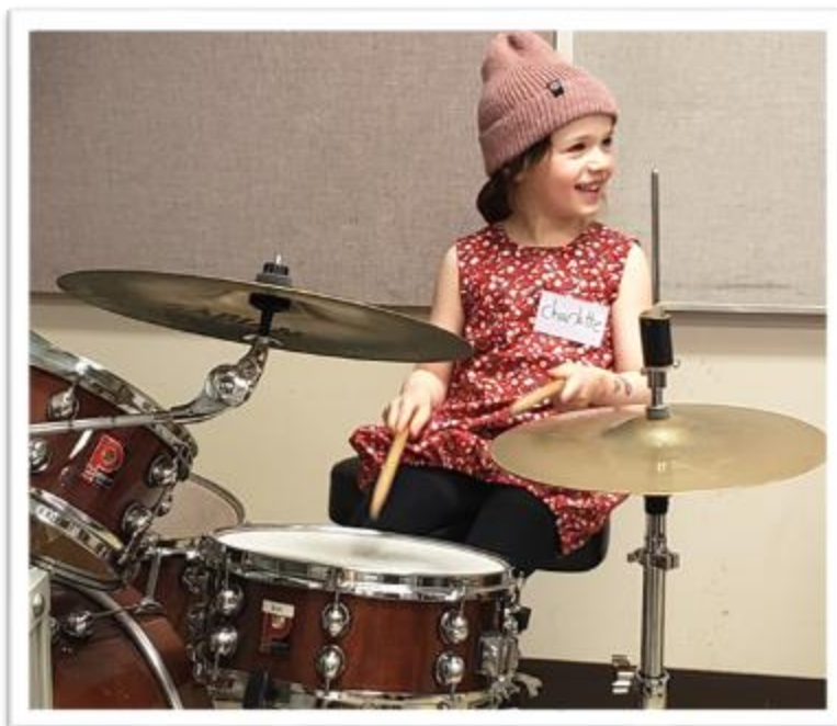
Une jeune élève découvrant la batterie lors d'une activité d'initiation 'À la découverte des instruments'

L'École de musique l'Accroche Notes a inscrit 9 élèves à l'École préparatoire de musique Anna-Marie-Globenski en 2022, pour un total de 11 examens.